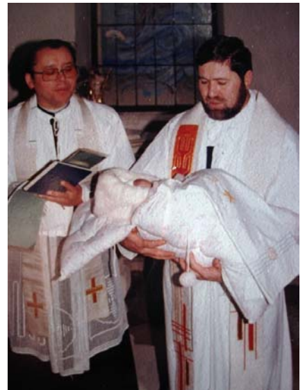
Lasst die Kinder zu mir kommen...

Ruhe selbst einteilen kann, und auf der anderen Seite stehen die seelsorglichen Tätigkeiten. Da kann es schon zu ungeplanten Einsätzen kommen, wenn du z.B. zu einer Krankensalbung gerufen wirst oder kurzfristig ein Begräbnis einplanen musst.