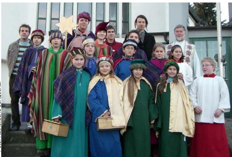
Am Dreikönigstag feierte die Pfarrgemeinde den Familiengottesdienst mit den Sternsängern und ihren Begleitern.