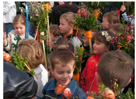
Der Kindergarten freut sich schon auf den Palmsonntag am 1. April