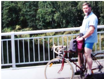
Unterwegs in Österreich

Ansonsten sollte man viel Rad fahren und Sport betreiben. Wie der Doktor sagt: „Setz dich auf den Hometrainer drauf, dann geht der Blutdruck runter.“ Aber wenn ich da oben allein sitz, das ist nicht das Wahre! Lieber dreh ich meine kleinen Runden zu Fuß im Wald.