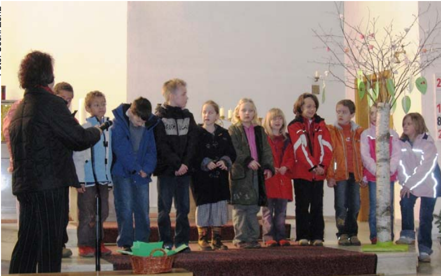
Nach dem heurigen Erstkommunion-Motto „Mit dir kann ich wachsen“ pflanzten die Erstkommunionkinder beim Vorstellungsgottesdienst am 4.3.2007 einen Baum in der Kirche, der bereits erste Früchte mit dem Foto eines jeden Kindes trägt...