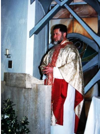
Sonntag in Laßnitzhöhe - 9:17

den offiziellen Pfarrer herauskehren, sondern möchte - als Mensch - „Ich selbst“ sein können und bleiben dürfen. Die Leute sollen trotzdem wissen, er steht für seine Botschaft ein.