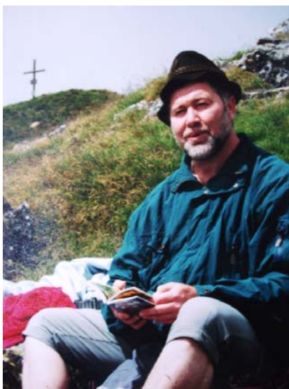
„Ich gehe gerne in die Berge...“

Mir wird immer angeraten, mach einen Tag frei. Der normale Pfarrer-freie Tag ist der Montag. Ich mach's aber so, dass ich 3 bis 4 Wochen zusammenwarte und