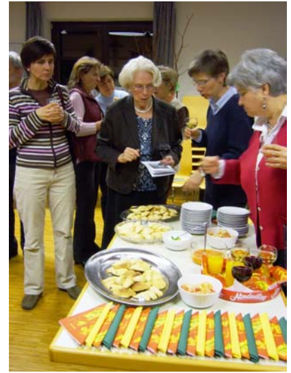
Der ökumenische Weltgebetstag der Frauen am 2.3.2007 zum Themenschwerpunkt Paraguay