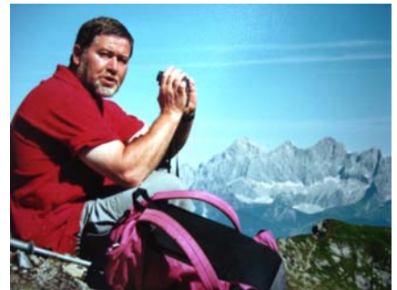
Einsichten und Ansichten

Freundlich bleiben, optimistisch, spontan