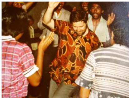
Bibelrunde - einmal anders!

Im Orden hatten wir fixe Gebetszeiten. Jetzt in der Pfarre halte ich es so, dass ich diese gemeinsam mit den Leuten in der Kirche verbringe - da ist man nicht allein. Außerdem haben wir in der Zwischenzeit wieder die Bibelrunden ins Leben gerufen.