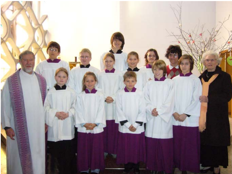
MinistrantInnen und HelferInnen der Pfarre Laßnitzhöhe